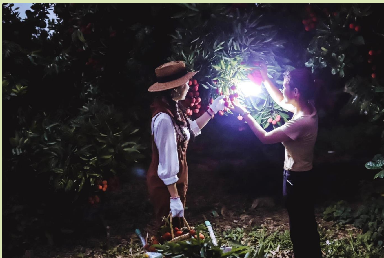
Trải nghiệm hái vải đêm Lục Ngạn

Lục Ngạn là miền đất được thiên nhiên ưu đãi với bốn mùa hoa thơm trái ngọt; mùa nào ở Lục Ngạn cũng có những vẻ đẹp đặc trưng riêng của vùng đất trái cây trĩu trĩu. Với dự phát triển của cách mạng khoa học công nghệ, du khách ở bất kỳ đâu trên mọi miền tổ quốc hay du khách quốc tế, chỉ cần vài thao tác trên mạng internet, tại các trang chuyên về đặt tour du lịch Bắc Giang là có thể được trải nghiệm tour độc đáo này. Từ Hà Nội, xuất phát vào buổi sáng hay cuối chiều, sau một ngày làm việc mệt mỏi, du khách có thể nghỉ ngơi tại các homestay để chuẩn bị cho hành trình đêm độc đáo.