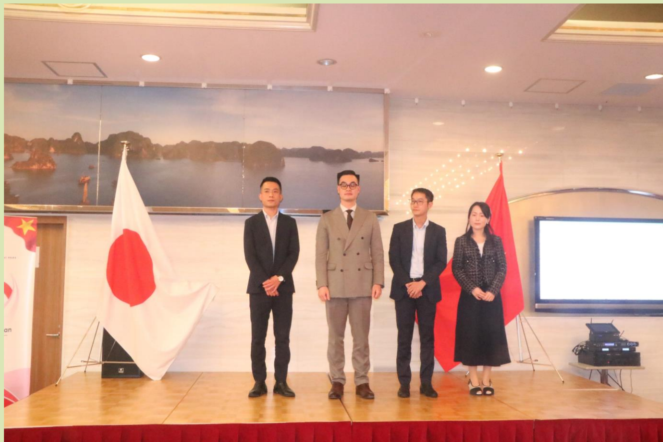
Ban Chấp hành Hội đồng hương Bắc Giang tại Nhật Bản nhiệm kỳ 2023-2025

Tại Tổng Lãnh sự quán Việt Nam ở Osaka (Nhật Bản) vừa diễn ra lễ ra mắt Ban Chấp hành Hội đồng hương Bắc Giang tại Nhật Bản nhiệm kỳ 2023-2025.