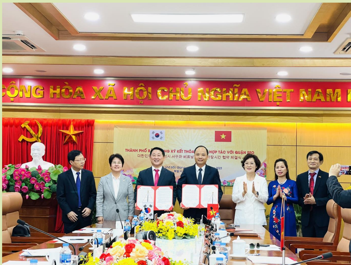
The government of Seo-gu district, Daejeon city (Republic of Korea) and the people's committee of Bac Giang city sign cooperation agreement in some sectors

Currently, the province is home to 344 investment projects from RoK, ranking 1 st in terms of the number of projects among 27 countries and territories investing in Bac Giang province.