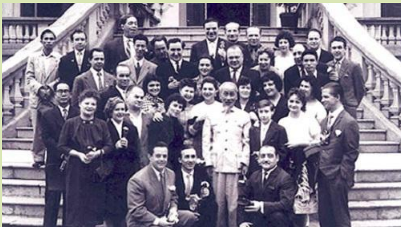
Bác Hồ với các nhà ngoại giao quốc tế tại Thủ đô Hà Nội

Đối ngoại nhân dân Việt Nam bắt nguồn từ những năm 1920 của thế kỷ XX, thời kỳ Chủ tịch Hồ Chí Minh ở Pháp hoạt động chính trị đối ngoại, lúc đó vận động quốc tế là hoạt động đối ngoại nhân dân. Chính Người đã nhận thức đúng đắn về vai trò của công tác quan trọng này và đặt công tác này vào mặt bằng mới vào cả lý luận lẫn thực tiễn nhờ đó đã vận động được nhân dân thế giới ủng hộ đoàn kết với nhân dân ta chống thực dân Pháp xâm lược đặc biệt là hình thành mặt trận nhân dân thế giới rộng lớn ủng hộ, đoàn kết với nhân dân ta chống Mỹ.