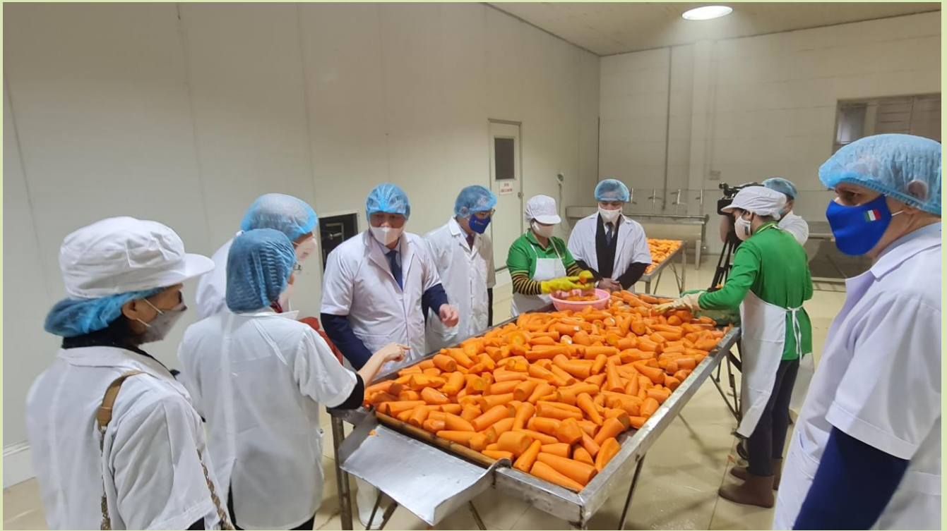
The delegation of Italian Embassy visits the farm product processing chain in Vifoco Company, Song Khe commune, Bac Giang city

Bac Giang province prioritizes comprehensive development of the economic sectors in which industrial sector is the main driving force, agriculture is the foundation and service sector is the booster.