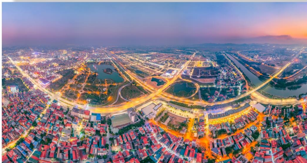
Van Trung industrial park from the bird's eye view

5 tháng đầu năm 2023, Bắc Giang tiếp tục nằm trong top đầu toàn quốc về thu hút đầu tư FDI với số vốn thu hút FDI đạt hơn 1,1 tỷ USD. Ngoài các tập đoàn công nghệ lớn như: Foxconn, Luxshare..., Bắc Giang cũng là điểm đến của các dự án xanh như Tập đoàn Yadea sản xuất xe máy điện, Fulian sản xuất linh kiện điện tử, máy vi tính và thiết bị truyền thông hay Hainan Longi Green Energy sản xuất pin năng lượng mặt trời.