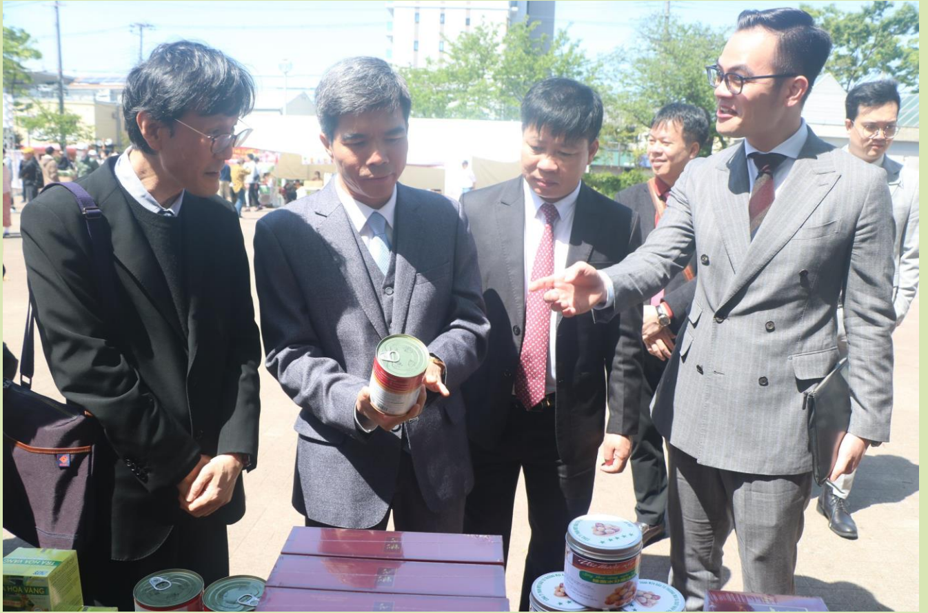
The exhibition booth to showcase some products of the province at the ceremony to celebrate King Hung death anniversary in Osaka, Japan.